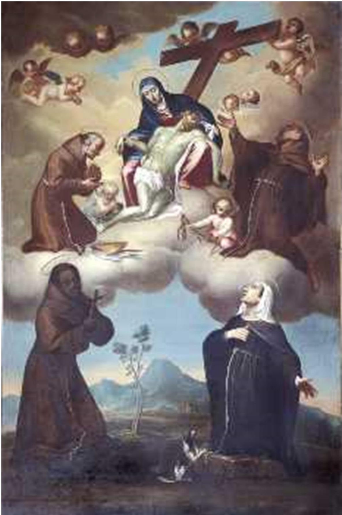
Parrocchia Santa Maria Immacolata delle Grazie - Bergamo